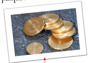
Palet en laiton

Le palet se joue sur une plaque en plomb de 45x45 cm et doit peser au minimum 20Kg