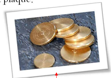
Palet en laiton

Le palet laiton se joue à 2m80 de la plaque