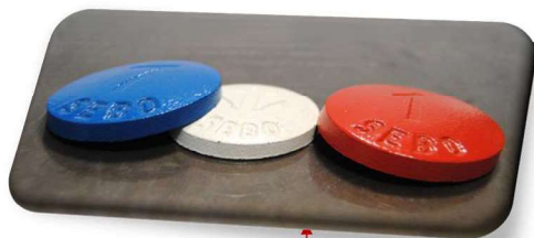
Palet en fonte

Le but du jeu : est d'être le premier, en individuel ou en équipe, à faire 11 ou 13 points en plaçant ses palets le plus près du « maître ». On compte un point par palet placé plus près du « maître » que celui de l'adversaire. Pour qu'un palet soit compté comme valable il ne faut pas qu'il touche le sol avant d'arriver sur la plaque et qu'il reste sur la plaque.